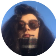
İrem Güneç Fotografie und Video