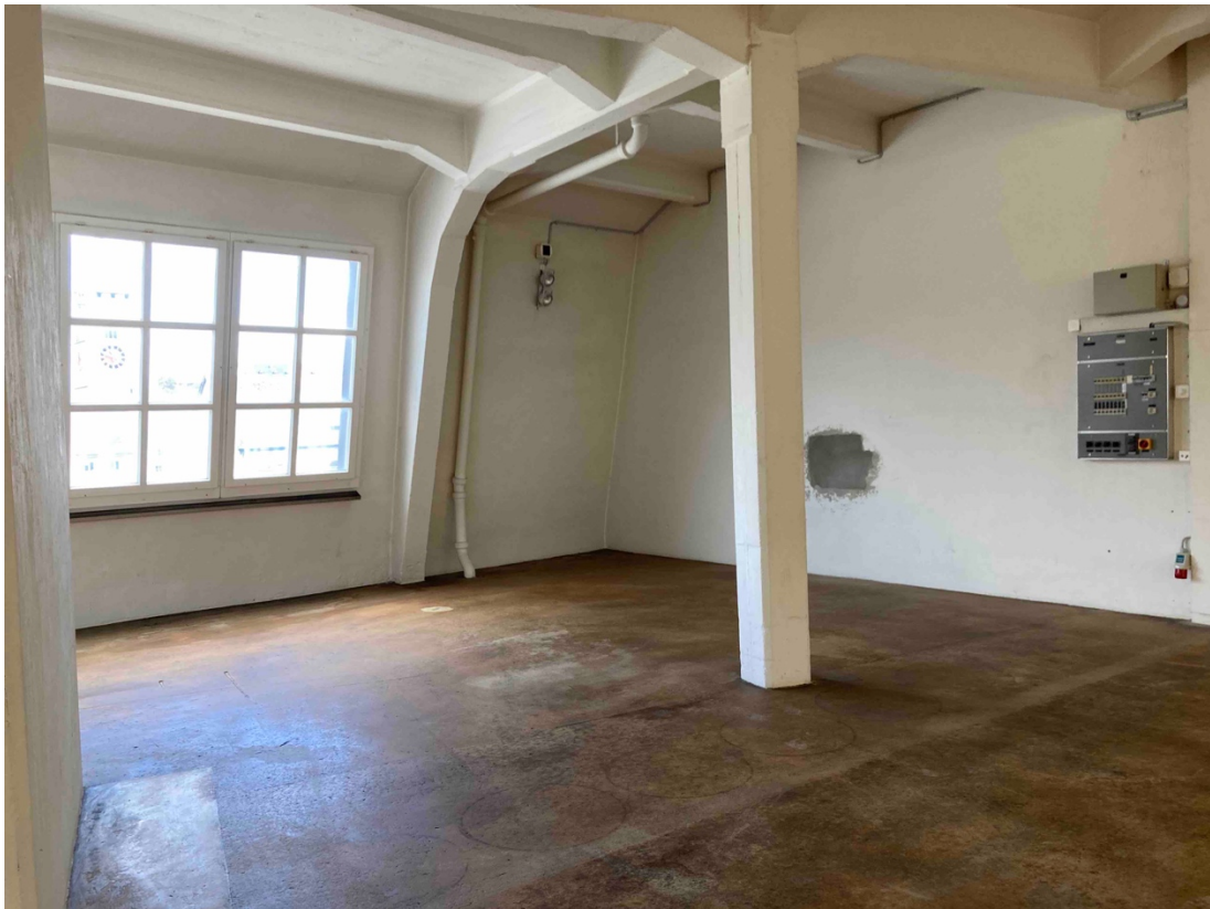
FATcafé/bar und Konzerte