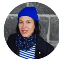
Nusa Núñez de La Torre Digitales