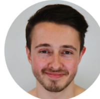
Lukas Jäger Grafik