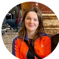
Gesa Röllinger Website